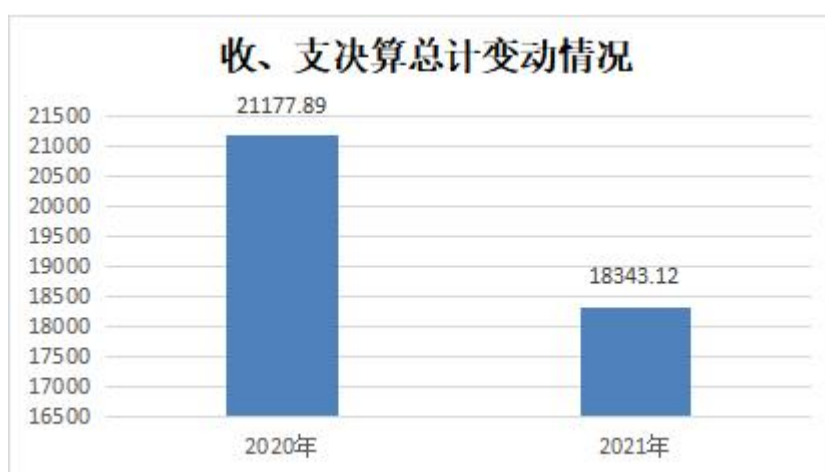
图 1：收、支决算总计变动情况（万元）

2021 年度收、支总计 18343.11 万元。与 2020 年度相比，收、支总计各减少 2834.78 万元，下降 13.39%，主要原因是 1、2021 年疫情可控，减少了卫生健康支出；2、2021 年减少对创新创业扶持建设中心支出。