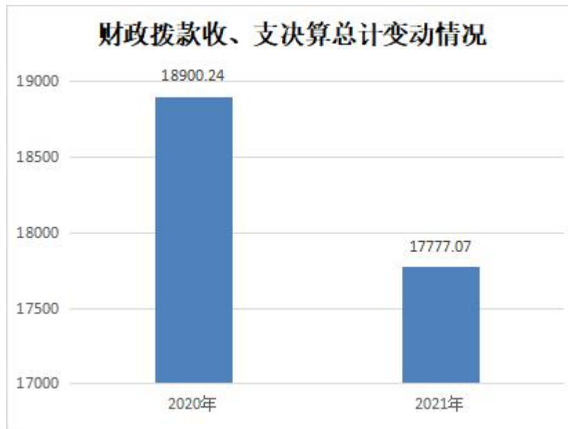
图 4：财政拨款收、支决算总计变动情况（万元）

比，财政拨款收、支总计各减少 1123.17 万元，下降 5.94%。主要原因是 1、2021 年疫情可控，减少了卫生健康支出；2、2021 年减少对创新创业扶持建设中心支出。