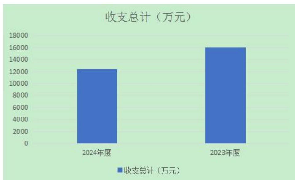
图 1：收、支决算总计变动情况

2024 年度收、支总计（含结转结余）均为 12373.54 万元。与 2023 年度相比，收、支总计（含结转结余）减少 3627.48 万元，下降 22.7%，主要原因是减少社会保障和就业支出、卫生健康支出、城乡社区支出、住房保障支出、国有资本经营预算支出。