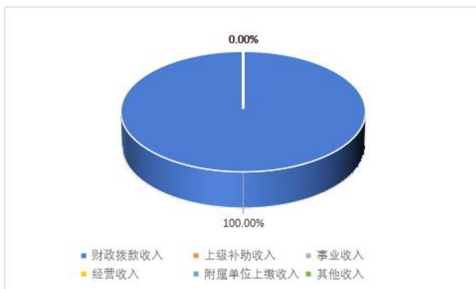
图 2: 收入决算结构