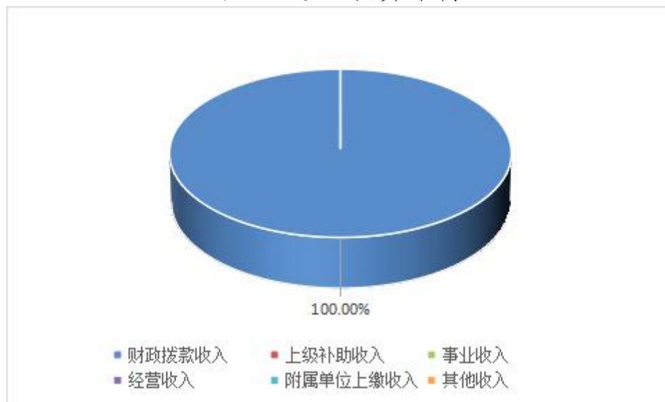
图 2: 收入决算结构

2022 年度收入合计 288.84 万元，与 2021 年度相比，收入合计增加 41.46 万元，增长 16.76%。其中：财政拨款收入 288.84 万元，占本年收入 100%。本年度无上级补助收入、事业收入、经营收入、附属单位上缴收入、其他收入。