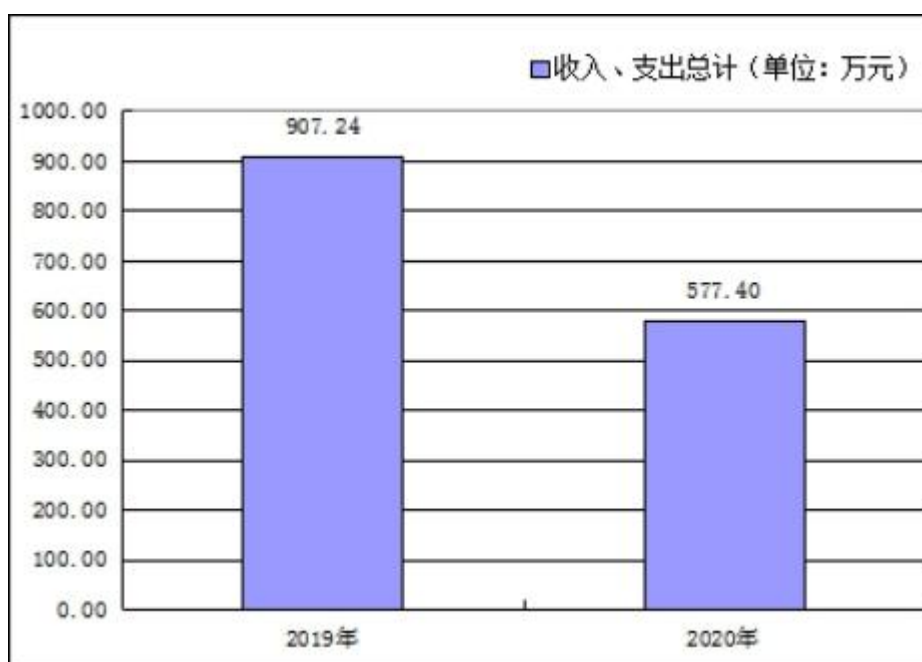
图 1：收、支决算总计变动情况

2020 年度收、支总计 577.40 万元。与 2019 年度相比，收、支总计各减少 329.84 万元，下降 36.36%，主要原因是项目数额减少以及疫情原因压减项目经费。