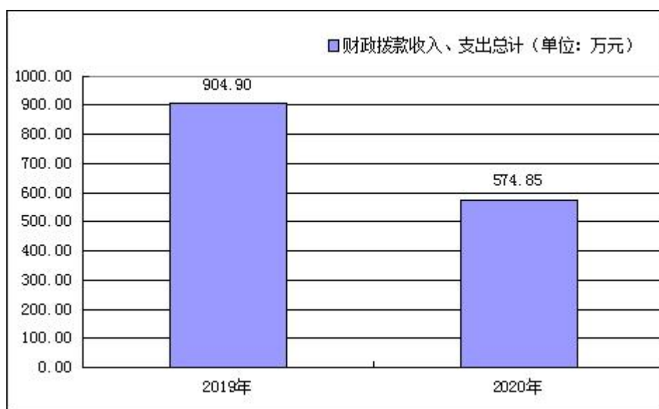
图 4：财政拨款收、支决算总计变动情况

2020 年度财政拨款收、支总计 574.85 万元。与 2019 年度相比，财政拨款收、支总计各减少 330.05 万元，下降 36.47%。主要原因是项目数额减少以及疫情原因压减项目经费。