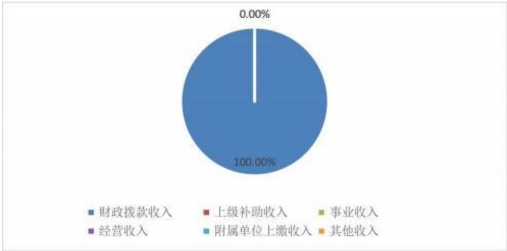
图 2: 收入决算结构