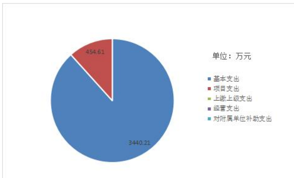
图 3: 支出决算结构