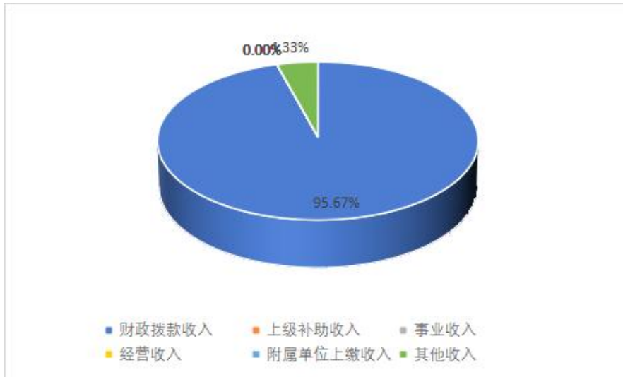
图 2: 收入决算结构

其他收入 149.59 万元，占本年收入 4.33%。本年度无上级补助收入、事业收入、经营收入、附属单位上缴收入。