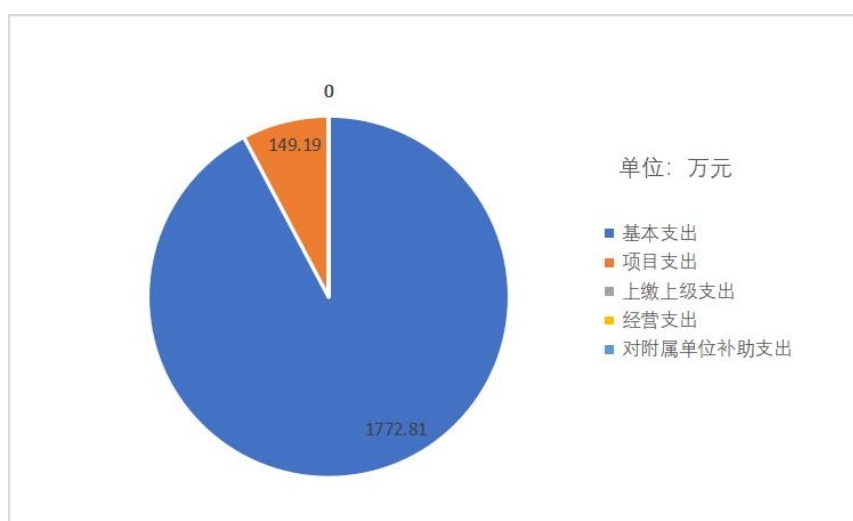
图 3: 支出决算结构

其中：基本支出 1772.81 万元，占本年支出 92.24%；项目支出 149.19 万元，占本年支出 7.76%；本年度无上缴上级支出、经营支出、对附属单位补助支出。