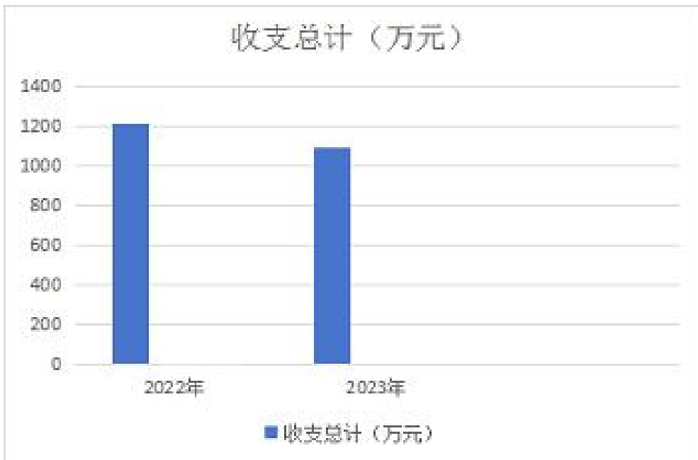
图 1: 收、支决算总计变动情况

2023 年度收、支总计均为 1092.15 万元。与 2022 年度相比，收、支总计各增减少 125.59 万元，下降 10.31 %，主要原因是：1. 2023 年我单位退休两名副处级领导，军转一名副处级领导、新进一名事业编同事。2. 上年有财政预拨款项，在上年度未做支出，而是年末作为单位往来处理，在本年年年初时把上年往来冲回，此笔金额作为本年业务支出处理。且上年有军运会项目，此项目连续持续了 2 年，一直在上年才彻底结束，并实际支付审计项目经费，故本年项目经费相对减少。