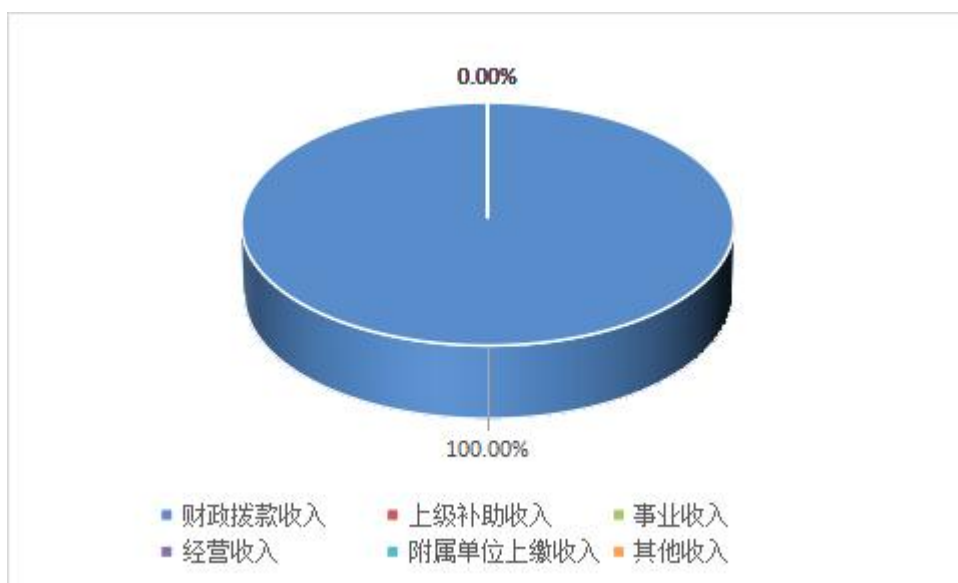
图 2: 收入决算结构