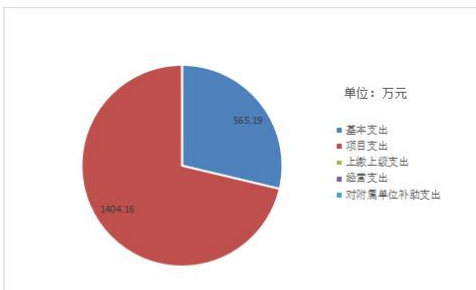
图 3: 支出决算结构

2023 年度支出合计 1969.35 万元，与 2022 年度相比，支出合计增加 125.04 万元，增长 6.8%。其中：基本支出 565.19 万元，占本年支出 28.7%；项目支出 1404.16 万元，占本年支出 71.3%。本年度无上缴上级支出、经营支出、对附属单位补助支出。