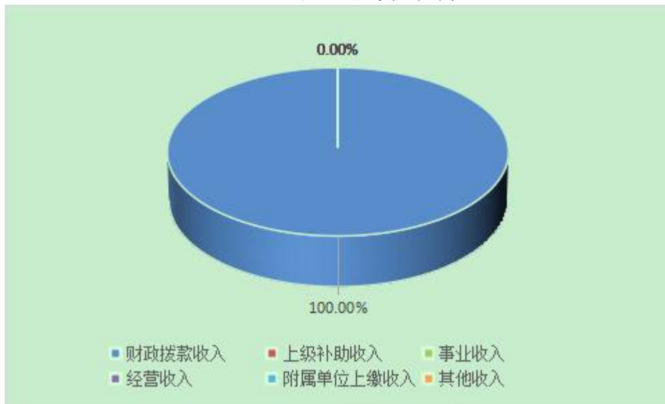
图 2: 收入决算结构