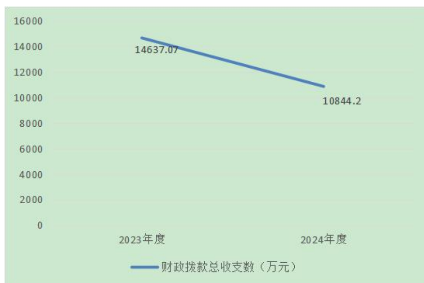
图 4：财政拨款收、支决算总计变动情况