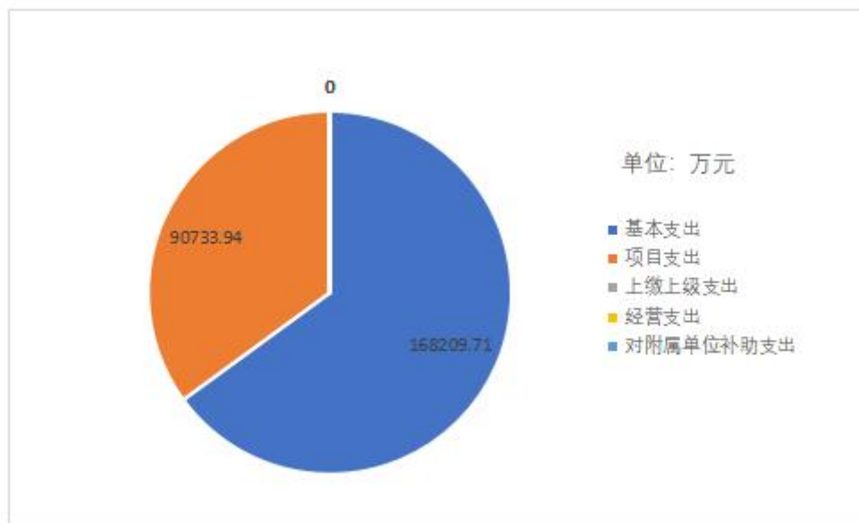
图 3: 支出决算结构