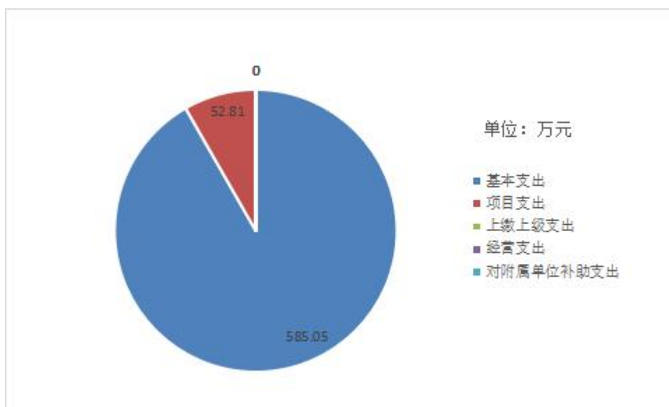
图 3: 支出决算结构