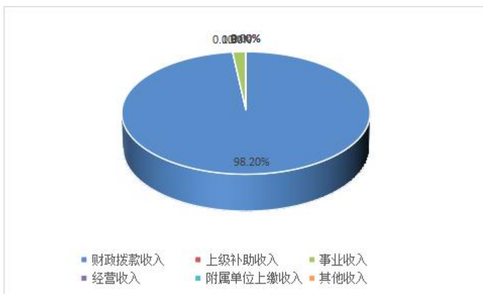
图 2: 收入决算结构