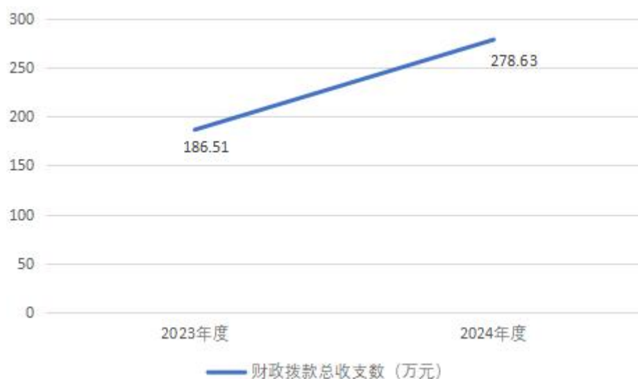
图 4：财政拨款收、支决算总计变动情况

2024 年度财政拨款收入中，一般公共预算财政拨款收入 278.63 万元，比 2023 年度决算数增加 92.12 万元，增加主要原因是 2024 年单位开始独立核算，各项经费均有所增加。本年度无政府性基金预算财政拨款收入和国有资本经营预算财政拨款收入。