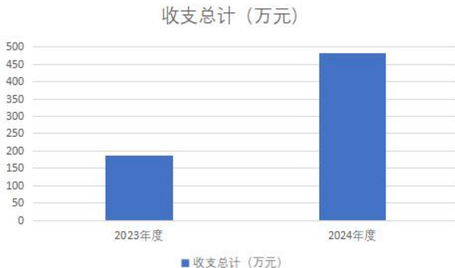
图 1：收、支决算总计变动情况

2024 年度收、支总计均为 481.90 万元。与 2023 年度相比，收、支总计增加 295.39 万元，增长 158.4%，主要原因是 2024 年单位开始独立核算，各项经费均有所增加。