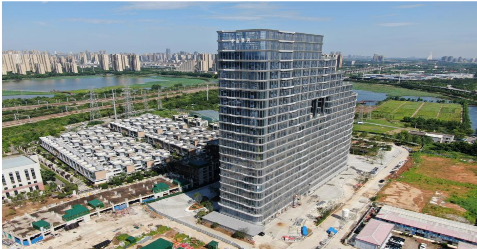
建筑物名称招牌标识