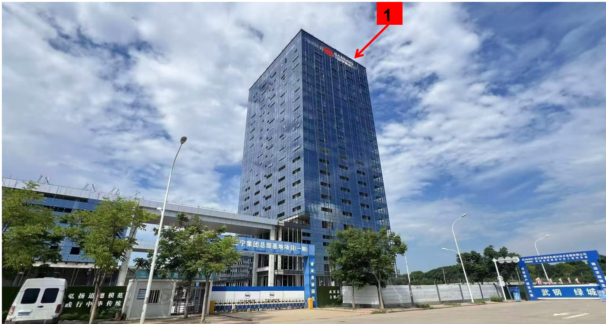
建筑物名称招牌标识