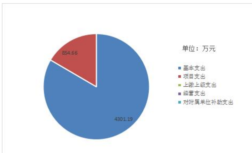
图 3: 支出决算结构