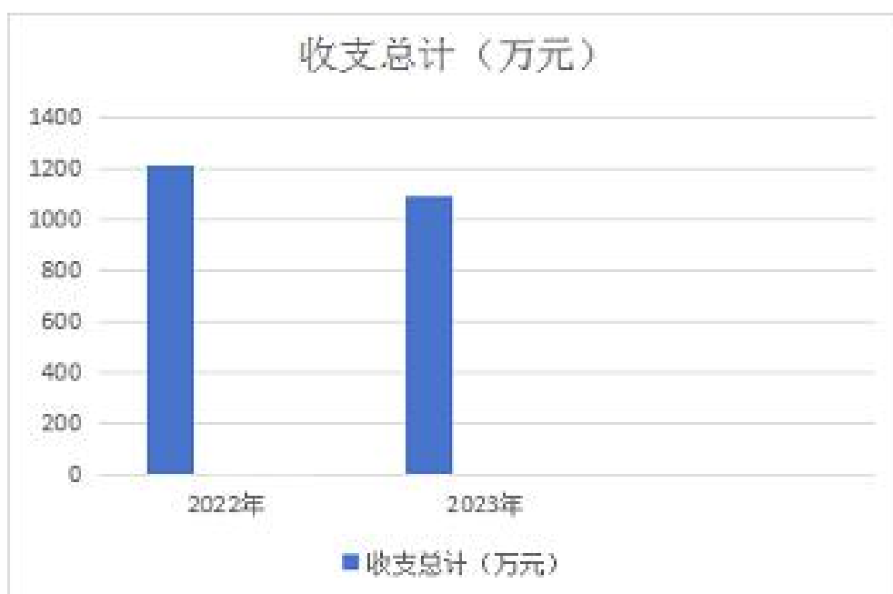
图 1：收、支决算总计变动情况

2023 年度收、支总计均为 1092.15 万元。与 2022 年度相比，收、支总计各增减少 125.59 万元，下降 10.31 %，主要原因是：1. 2023 年我单位退休两名副处级领导，军转一名副处级领导、新进一名事业编同事。2. 上年有财政预拨款项，在上年度未做支出，而是年末作为单位往来处理，在本年年初时把上年往来冲回，此笔金额作为本年业务支出处理。且上年有军运会项目，此项目连续持续了 2 年，一直在上年才彻底结束，并实际支付审计项目经费，故本年项目经费相对减少。