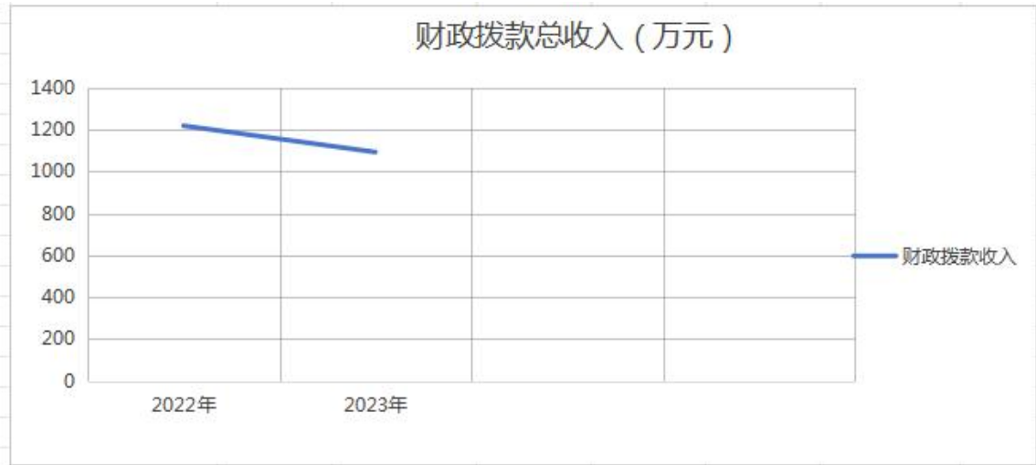
图 4: 财政拨款收、支决算总计变动情况