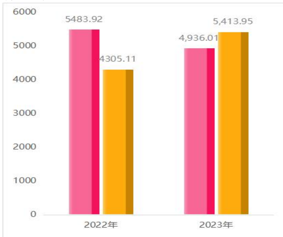
图 1: 收、支决算总计变动情况

2023 年度收入总计为 4936.01 万元，支出总计为 5413.95 万元。与 2022 年度相比，收入总计减少 547.91 万元，下降 9.99%，主要原因是本年度核酸采样经费收入减少 1034.82 万元。支出总计增加 1108.84 万元，增长 25.76%，主要原因是本年度基本公共卫生支出增加 410.66 万元，核酸采样支出增加 488.98 万元。