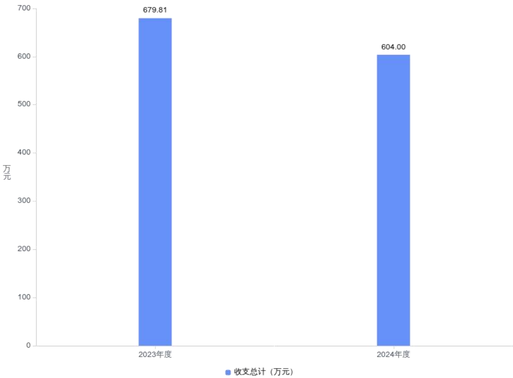
图 1：收、支决算总计变动情况

2024 年度收、支总计均为 604.00 万元。与 2023 年度相比，收、支总计减少 75.81 万元，下降 11.2%，主要原因是人员减少导致人员经费及人员公用经费的减少。