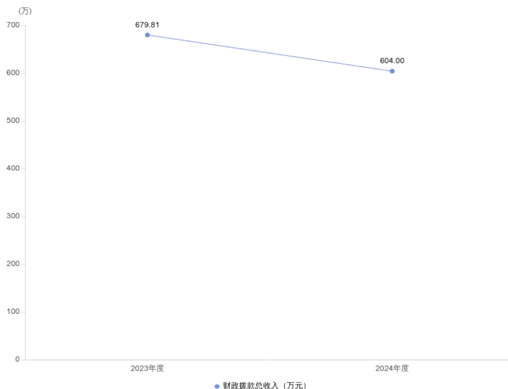
图 4：财政拨款收、支决算总计变动情况